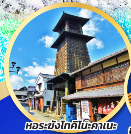
หอรบั้งโทคิโนะคาเนะ