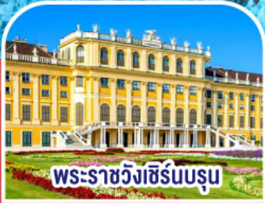
พระราชวังเชิร์นบรุน