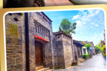
ถนนคนเดินชอยกว้างชอยแคบ