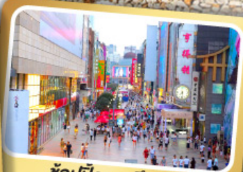
ช้อปปิ้งถนนซีลชีลู