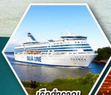
เรือสำราญ TALLINK SILJA LINE