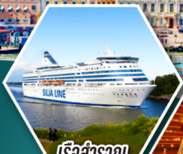
เรือสำราญ TALLINK SILJA LINE