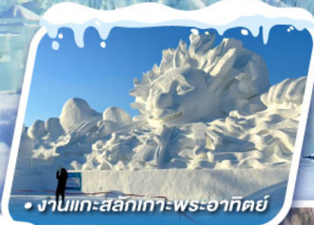
งานแกะสลักเทวา-พระอาทิตย์

งานเทศกาลแกะสลักหิมะที่ใหญ่ที่สุดในโลก HARBIN ICE & SNOW FESTIVAL 2025 เที่ยวหมู่บ้านหิมะ ดินแดนหิมะอันสุดประทับใจ