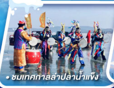
ชมเทศกาลล่าปลาน้ำแข็ง