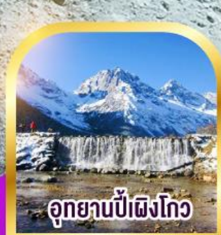
อุทยานปี่เผิงโกว