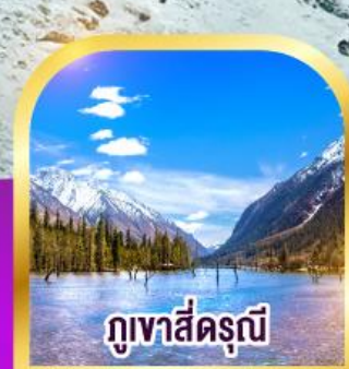
ภูเขาสี่ตรุนี