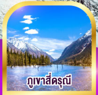
ภูเขาสี่ตระกูล