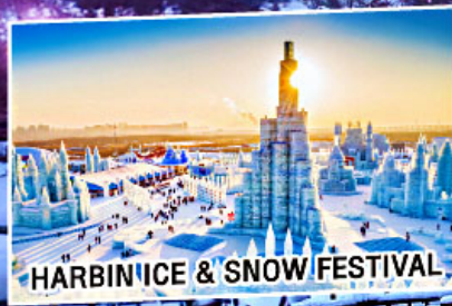
HARBIN ICE & SNOW FESTIVAL