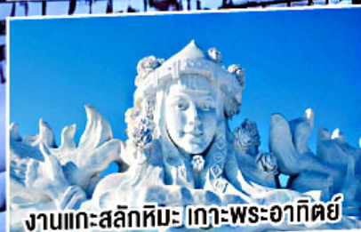
งานแกะสลักหิมะ เกาะพระอาทิตย์