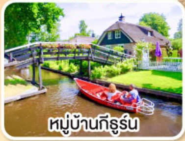
หมู่บ้านที่รูร์น