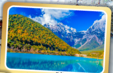
ทะเลสาบไป๋สือเหอ