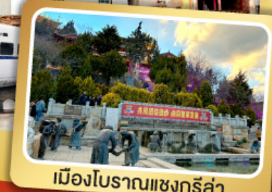
เมืองโบราณแชนกรีล่า