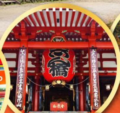
วัดอาซากุซะ