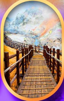
หุบเขานรกจิงคุดานิ