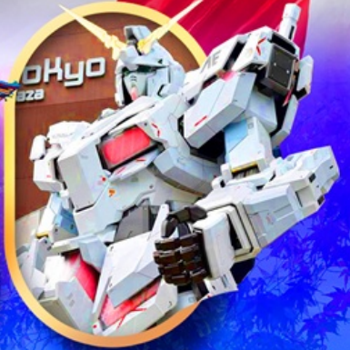
ห้างไอโดะบะกันดัม