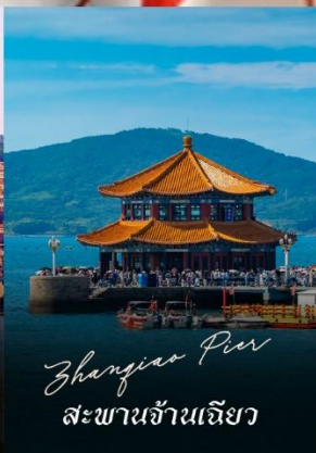
Zhangjiao Pier สะพานจ้านเจียว