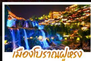
เมืองโบราณฝูเจียง