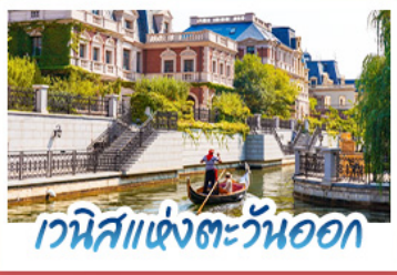
เวนิสแห่งตะวันออก