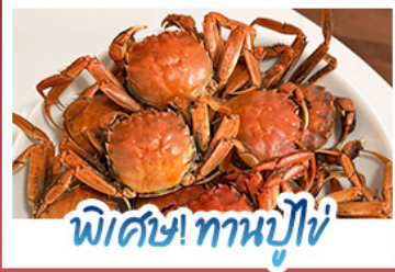
พิเศษ! ทานปูไข่

ปรากฏการณ์ธรรมชาติ 1 ปี มีแค่ครั้งเดียว! เตรียมชุดกันไปถ่ายรูปกับ 'หาดแดงผาจีน' ที่กำลังพรมสีแดงสดไปทั่วผืนน้ำ พร้อมฟินสุดขีดกับฤดูกาลทานปูไข่ที่ดีที่สุดแห่งปี • สัมผัสเวนิสแห่งตะวันออกที่ด้าหลิเยน