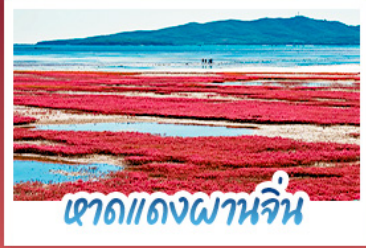
เขาดแดงผาจีน