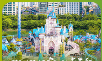
สวนสนุกโลกอเวเจอร์ Lotte Adventure World