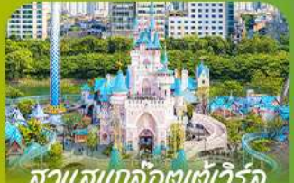
สวนสนุกโลกเอเตอ์เวิร์ล Lotte 'adventure world