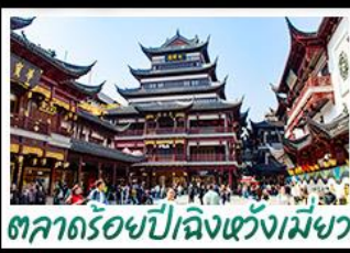
ตลาดร้อยปีเจียงหวงเมี่ย