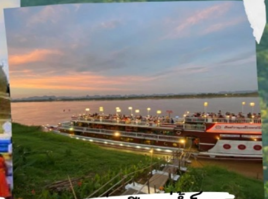
ล่องเรือแม่ฟ้าหลวง