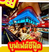
บูฟเฟต์ซีฟู้ด