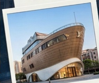
เข็ควินเรือหลุยส์วิทอง