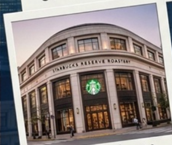
สตาร์บัคเซี่ยงไฮ้