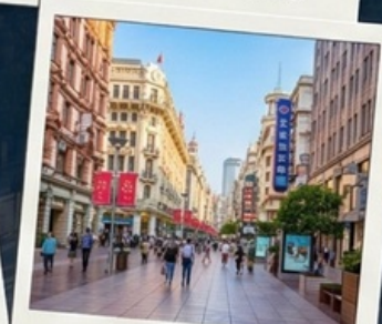
ช็อบปิงถนนนานจิง