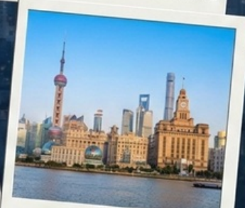
เข็ควินที่เดอะบันด์