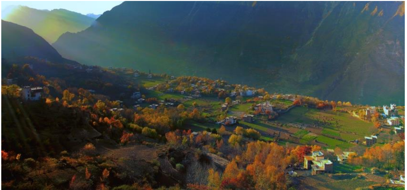
Photo shows the picturesque autumn scenery of Danba county, southwest China's Sichuan Province.

นำท่านนั่งรถของอุทยาน เข้าชม ซวงเฉียวโกว หรือ หุบเขาสะพานคู่ มีระยะทาง 34.8 กม. มีพื้นที่รวม 216 ตารางกิโลเมตร จุดท่องเที่ยวแบ่งออกเป็น 3 ส่วน ส่วนแรก หุบเขาหยินหยาง หุบต้นหยาง แล้วเดินทางเข้าสู่สวนลิกสุดท่านจะได้เห็นธารน้ำแข็ง ภูเขากระจกแก้ว ภูเขาดวงอาทิตย์ ภูเขาดวงจันทร์ ยอดเขากระต่าย ส่วนกลาง นำท่านย้อนกลับมาชมทะเลสาบ ส่วนที่สาม นำท่านชมทุ่งหญ้าเหนียนหยูป่า ชมยอดเขารูปร่างแปลกตา เช่น ยอดเขาพราน ยอดวังโปตาลา ยอดเขาเพชร ภูเขาหญิงตั้งครรภ์ ถ่ายรูปกันอย่างจุใจกับท้องทุ่งกว้างที่มีฉากหลังเป็นภูเขาสูงปกคลุมด้วยหิมะขาว ในหุบเขาจะมีลำธารใสสะอาด และสนสูงสีเขียวเข้มสลับด้วยต้นไม้หลายหลากเฉดสี เช่น เขียวอ่อน เขียวแก่ เหลืองส้ม แดง น้ำตาลเข้ม เนื่องจากอยู่ในฤดูกาลใบไม้เปลี่ยนสี