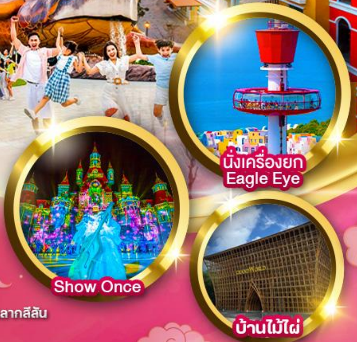
นั้งเครื่องยก Eagle Eye

"เวนิสแห่งเอเชีย" Grand World Phu Quoc สถาปัตยกรรมสไตล์ยุโรปหลากสีสัน