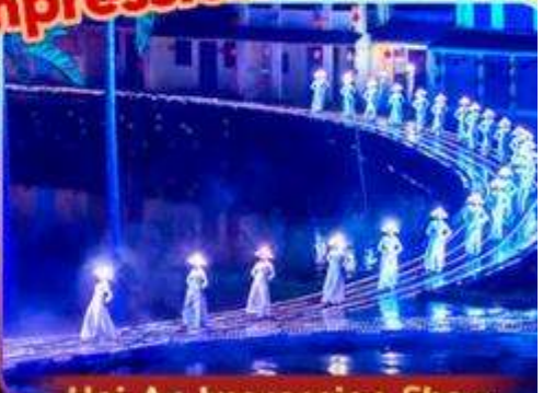
Hoi An Impression Show