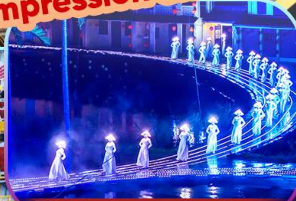
Hoi An Impression Show