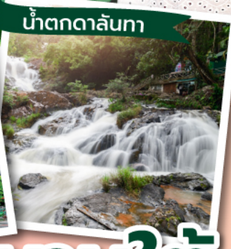
น้ำตกดาลันทา