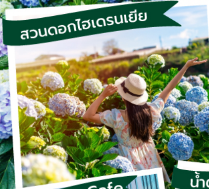
สวนดอกไฮเดรนเยีย