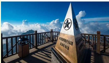
ยอดเขาฟานซิปัน