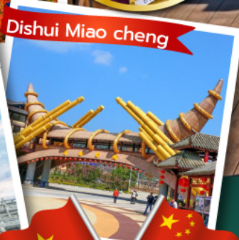
Dishui Miao cheng