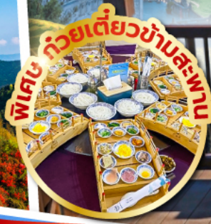
พิเศษ ภัตตาคารอาหาร