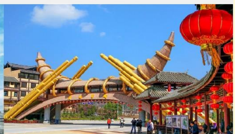
Dishui Miao cheng

*ทางบริษัทฯ ขอสงวนสิทธิ์ในการสลับโปรแกรมทัวร์ตามความเหมาะสมขึ้นอยู่กับสถานการณ์หน้างาน โดยคำนึงถึงผลประโยชน์ของลูกค้าเป็นสำคัญ