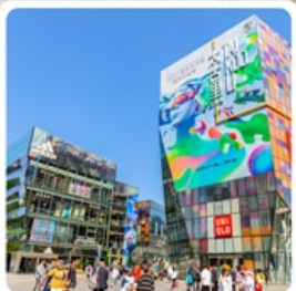
ย่านชานหลี่ถุน