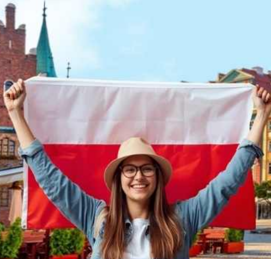
เที่ยวเมืองเกลือ

เล่นที่เมืองเก่าแห่งโปแลนด์ เที่ยวครบไฮไลท์ 9 วัน 6 คืน