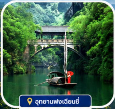
📍 อุทยานฟงเจียนซี

อุทยานฟงเจียนซี | ถ้ำเก้าสวรรค์ | หมู่บ้านซานเสี เมืองโบราณฝูหลงเจิน | ซิมอาหารเมบูพิเศษ บุปเฟ่ต์หมูย่างเกาหลี