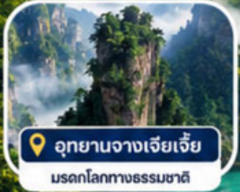
📍 อุทยานจางเจียเจีย