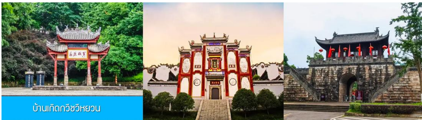
บ้านเกิดกวีขวิหยวน

วันที่หก เมืองหยีซัง –บ้านเกิดกวีขวิหยวน-สวนถ้ำสามสหาย- เดินทางกลับกรุงเทพ