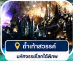
📍 ถ้ำเก้าสวรรค์