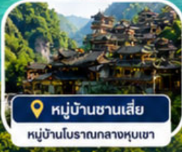
📍 หมู่บ้านซานเสี