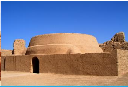
เมืองโบราณเกาซางกูเจิง