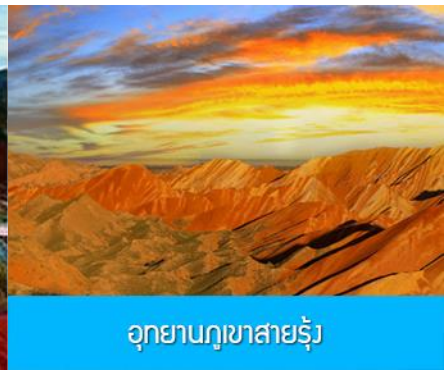
อุทยานภูเขาสายรุ้ง