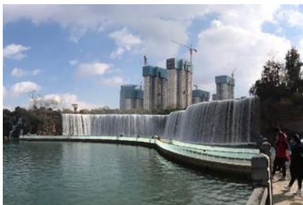
สวนน้ำตก Kunming Waterfall Park

พักที่ VIENNA HOTEL ระดับ 4 ดาว หรือเทียบเท่าในเมืองคุนหมิง