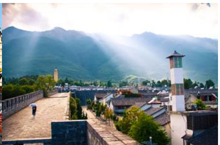
หมู่บ้านฮี้โจว(หมู่บ้านชาป๋อ)