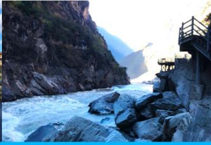
ช่องแคบเสือกะโจน