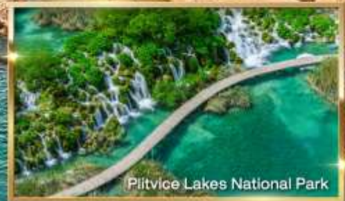
Piltvice Lakes National Park