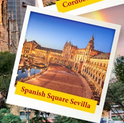
Spanish Square Sevilla