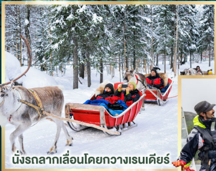
นั่งรถลากเลื่อนโดยกวางเรนเดียร์