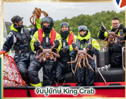
จับปูยักษ์ King Crab