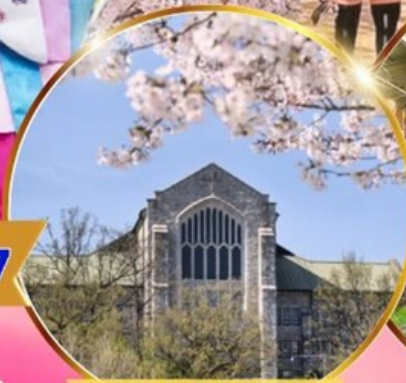
มหาวิทยาลัยสตรีอีชวา