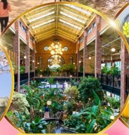
คาเฟ่ดัง Forest Outings