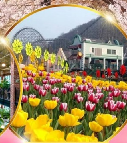
สวนสนุกเอเวอร์แลนด์