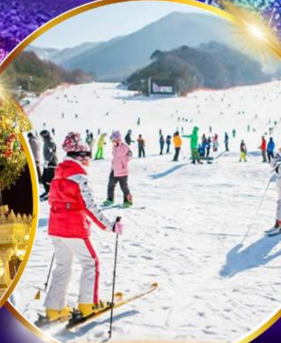
สนุกสุดมันส์ สกีรีสอร์ท

ชมจอ LED ขนาดยักษ์ที่รีสอร์ท 5 ดาว ใหญ่ที่สุดในเอเชียเหนือ สัมพัสมะสกีรีสอร์ท สนุกสุดมันส์ สวนสนุกเอเวอร์แลนด์ ชมพระราชวังคยองบกกุง ย้อนอดีตหมู่บ้านบุกซอน ฮันอก อิสระช้อปปิ้งคังนัม Lotte Duty Free