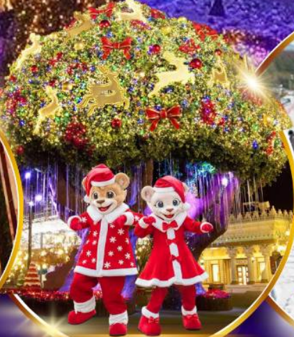
สวนสนุกเอเวอร์แลนด์ ฮิม พาร์ค