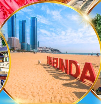
หาดแฮนแด