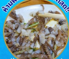
ชั้นนักชี อาหารท้องถิ่น