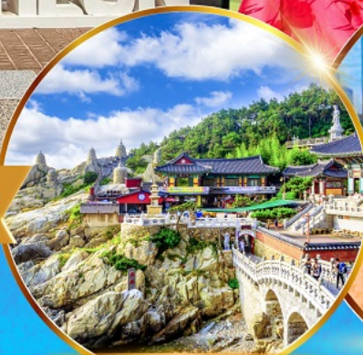
วัดแสงยงกุงซา