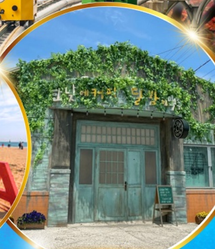
ตามรอยซีรีส์ดัง Hometown chachacha

โพฮังสเปซวอล์ค สกายวอร์ค ตามรอยซีรีส์ Hometown chachacha ถ่ายรูปชิคๆ หมู่บ้านวัฒนธรรมคิมซอน ขึ้นเคเบิลคาร์ ชมทะเลปูซาน นั่งรถไฟปูคปิก sky capsule ชิมของอร่อยตลาดแฮนแด อิสระช้อปปิ้ง Lotte Duty Free