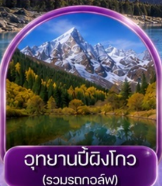
อุทยานปี้ผิงโกว (รวมรถกอล์ฟ)