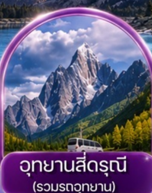
อุทยานสี่ดรุณี (รวมรถอุทยาน)