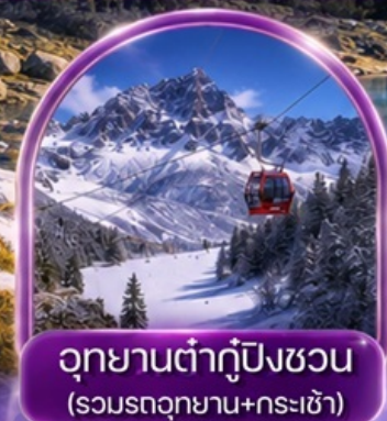
อุทยานต้ากู่ปิงชว่น (รวมรถอุทยาน+กระเช้า)

พิเศษ สุขี่หม่าล่า !! พร้อมน้ำจิ้มรสเด็ด