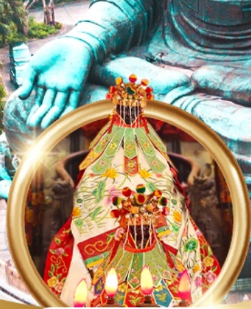
เยี่ยมเงินเจ้าแม่กวนอิมสองฮา