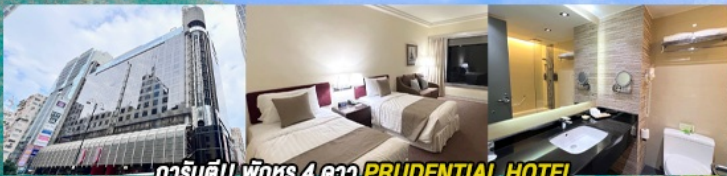
การ์ตูนดี!! พิเศษ 4 ดาว PRUDENTIAL HOTEL ติดถนนนาธาน ย่านช้อปปิ้งจิมซาจอย