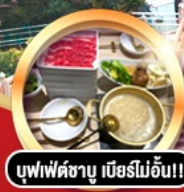
บุฟเฟ่ต์ชาบู เสิร์ฟไม่อั้น!!