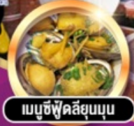
เมนูซีฟู้ดสัญมุน