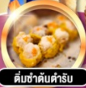
ต้มซ่าต้นตำรับ