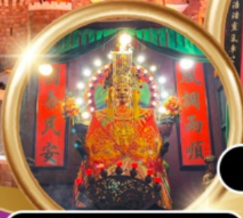
ขอพรซื้อขายอสังหาริมทรัพย์