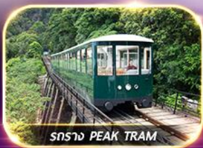
สราง PEAK TRAM