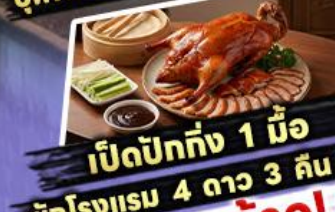
เปิดปีกทั้ง 1 มื้อ

พักรูม 4 ดาว 3 คืน ไฮไลท์ สุดว้าว! ขึ้นลิฟต์แก้วชมความอลังการ กลางหุบเขา