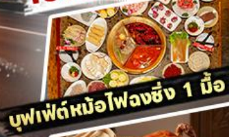
บุฟเฟ่ต์หน่อไพลงชิง 1 มื้อ