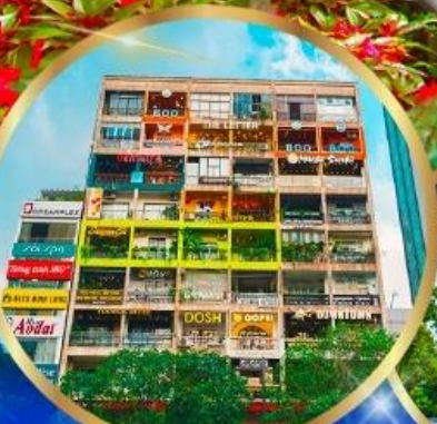
คาเฟ่ อพาร์ทเมนต์