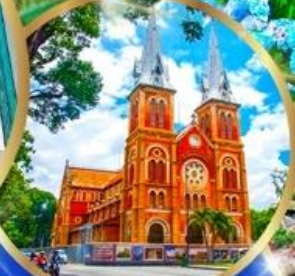
โบสถ์นอร์ทเธอดาม