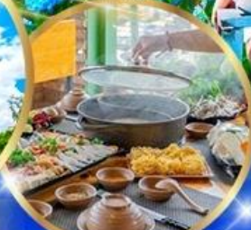
พิเศษ บุฟเฟ่ต์ 2 มือ