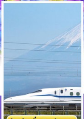
สัมปั่งนั่งชินคันเซน