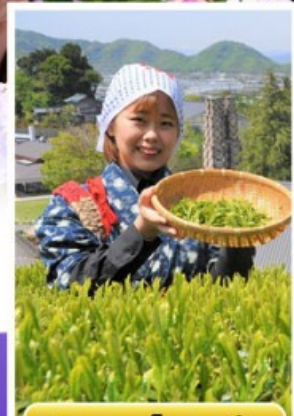
กิจกรรมเก็บชาเขียว