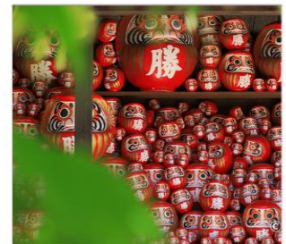
วัดคัตสึโองิ