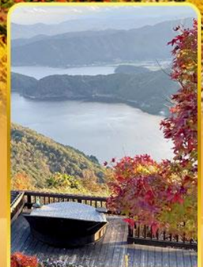
จุดชมวิวกะเลสาบมิกาดะ