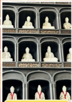
วัดโดชิซังเซโอดิจิ