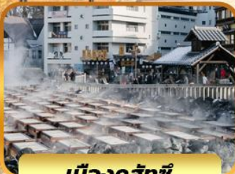
เมืองคุสัทชิ