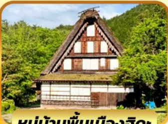
หมู่บ้านพื้นเมืองฮิดะ