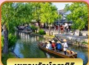
เขตอูร์กบิคุราชิกิ