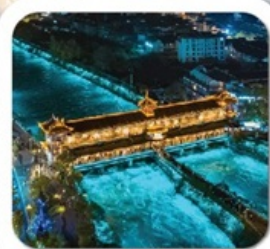
"สะพานหนานเจียว"